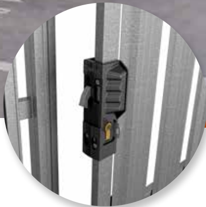
Wysokiej jakości pochwyt do drzwi rozwiernych z wkładką bębnową.