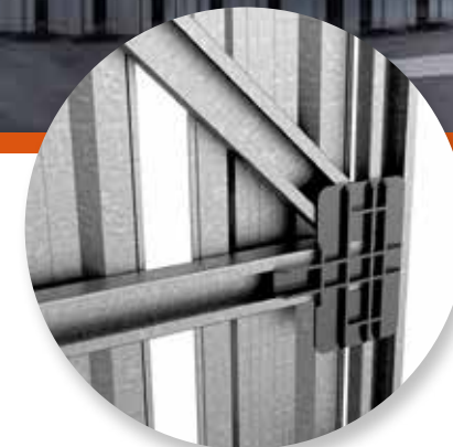
Specjalne łączniki do beznitowego łączenia konstrukcji ramy.

Długa żywotność dzięki przemyślanej konstrukcji