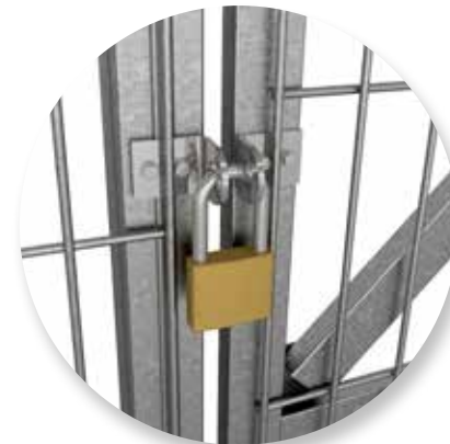
Zamknięcie na kłódkę.