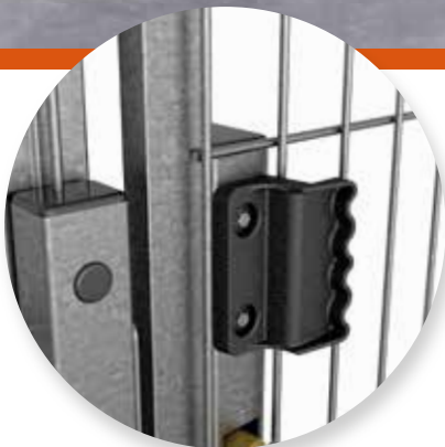
Praktická rukojeť pro posuvné dveře.