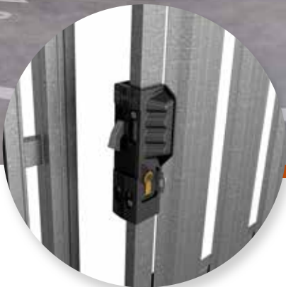
Vysoce kvalitní madlo pro křídlové dveře s bubnovou vložkou.