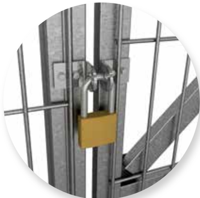
Uzavírání visacím zámkem.