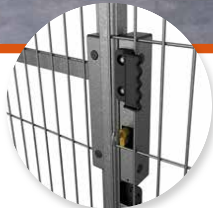
Integrovaný zámek pro posuvné vrata a dveře s bubnovou vložkou.